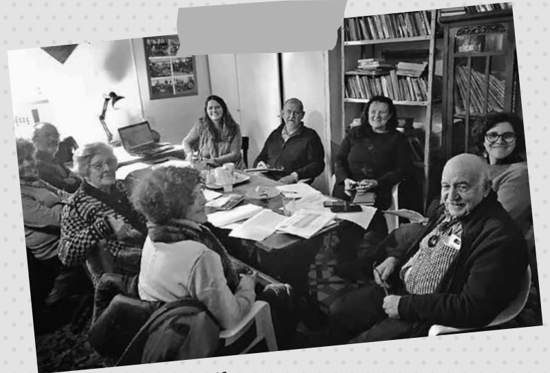
Consejo de Administración 2019