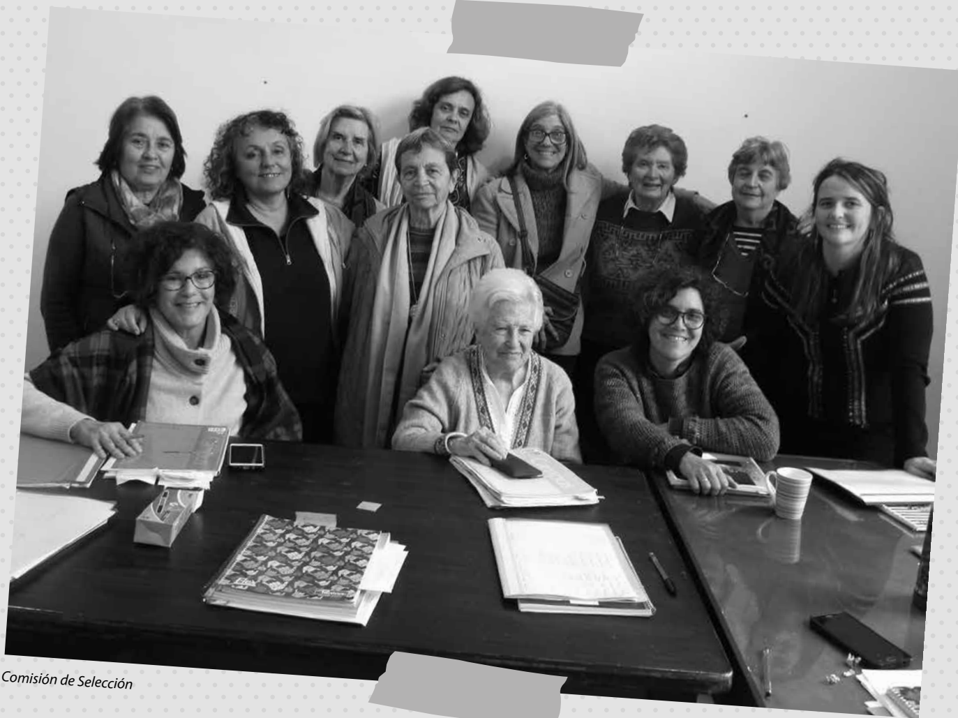
Comisión de Selección