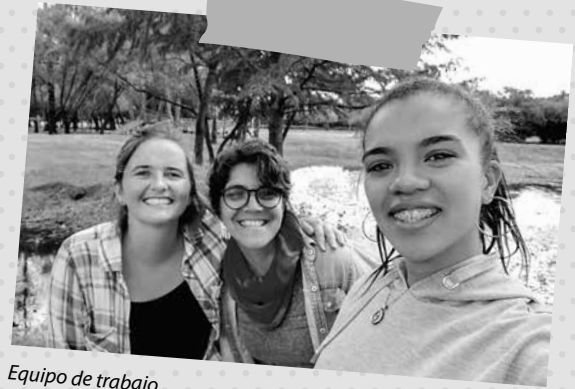
Equipo de trabajo

Se apoya a jóvenes uruguayos entre 18 y 30 años de edad, que demuestren una clara vocación, que aspiren a formarse o perfeccionarse como técnicos, artesanos, artistas, docentes o profesionales universitarios para ejercer su profesión al servicio del desarrollo económico, cultural y social del país y que presenten dificultades económicas y/o familiares para seguir con sus estudios o formación.