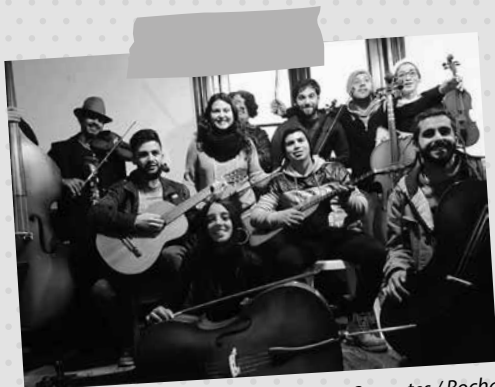
Grupos Sonantes / Rocha

Cada vez son más las Organizaciones de la Sociedad Civil, Centros Educativos y Colectivos de todo el país que nos abren las puertas para hacer posible que los becarios puedan dar una mano gratuitamente en lo que se necesite. Componente fundamental de la Beca de Chamangá: “mi vocación no solamente es para el crecimiento personal, sino que también para ser dada al otro, a la comunidad, en pos del desarrollo del país.”