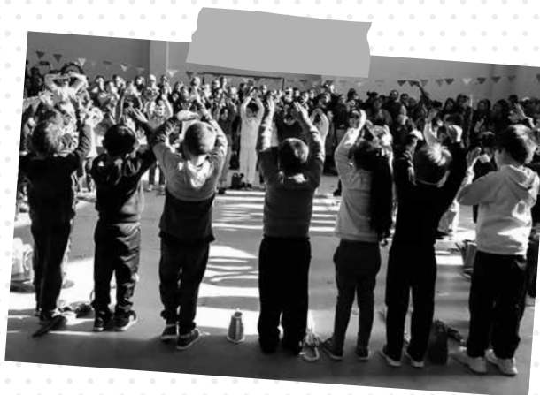
Escuela N° 137