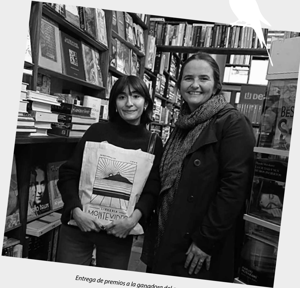
Entrega de premios a la ganadora del concurso

nuestros/as becarios/as, ex becarios/as y amigos/as. Al igual que cada año, contamos con el apoyo del Correo Uruguayo y el INJU/Mides en esta tarea.