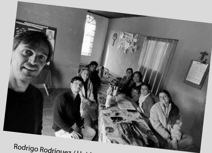
Rodrigo Rodríguez / Unidad Regional de Extensión, Salto