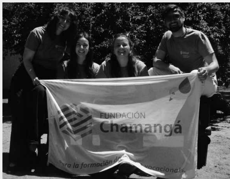
Equipo de trabajo

La Fundación Chamangá para la formación de jóvenes vocacionales, surge en el año 2000 por iniciativa de un grupo de amigos uruguayos y franceses que se propusieron promover a los jóvenes uruguayos, valorizando sus vocaciones y ayudando a su formación mediante la concesión de becas.