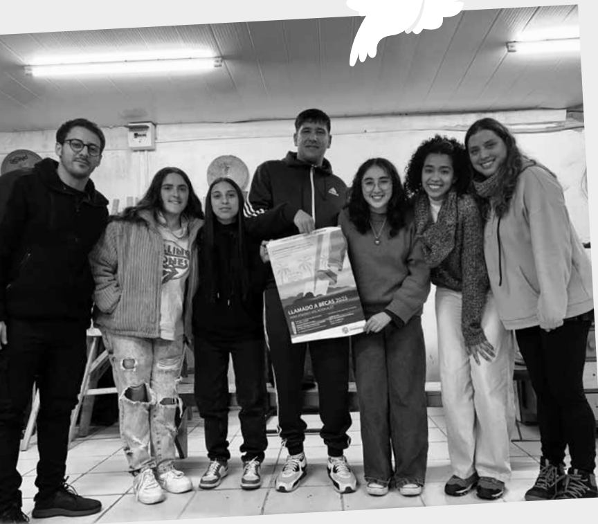
Difusión en Montevideo