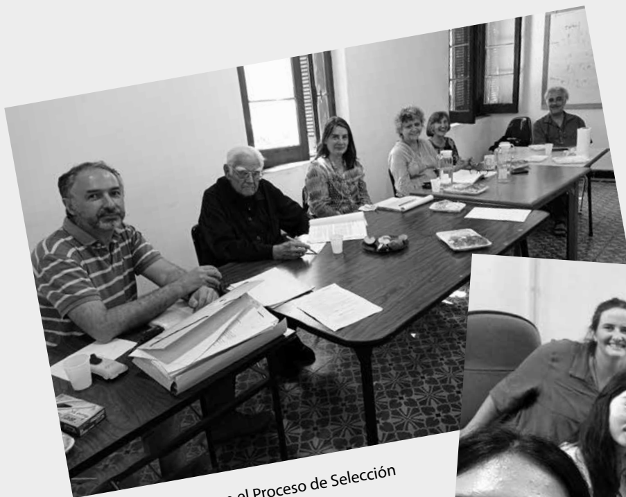
Instancia del Jurado en el Proceso de Selección