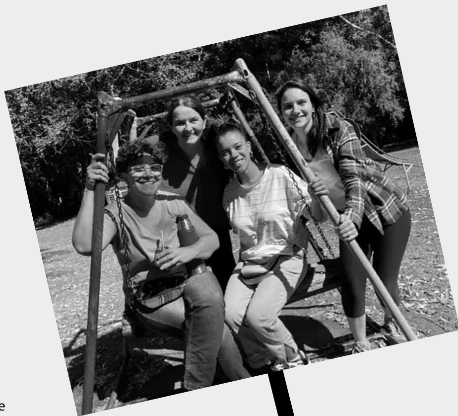
Equipo de trabajo

Se apoya a jóvenes uruguayos entre 18 y 30 años de edad, que demuestren una clara vocación, que aspiren a formarse o perfeccionarse como técnicos, artesanos, artistas, docentes o profesionales universitarios para ejercer su profesión al servicio del desarrollo económico, cultural y social del país y que presenten dificultades económicas y/o familiares para seguir con sus estudios o formación.