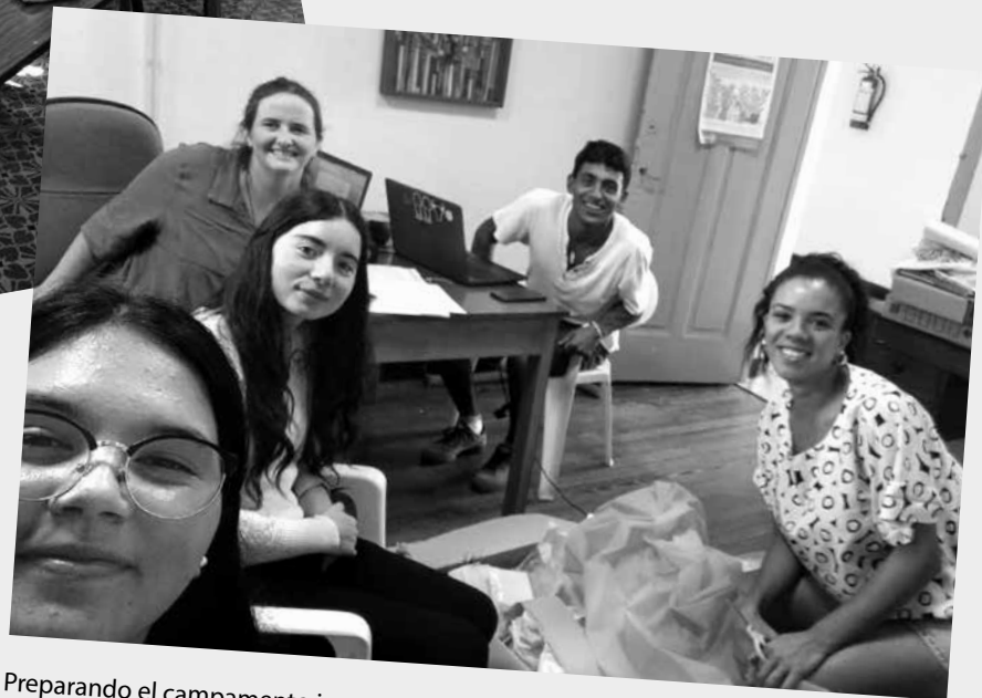
Preparando el campamento junto a becarios