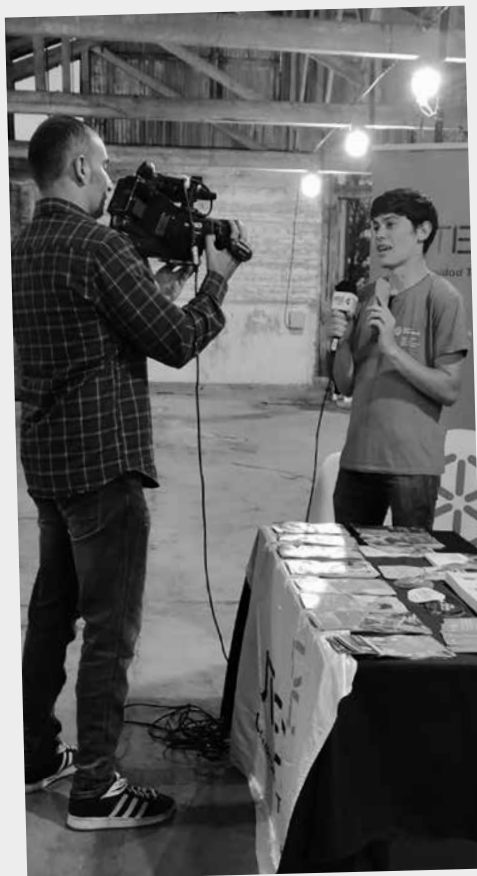
Difusión en Fray Bentos

Participamos de muchas entrevistas para radios y canales de televisión, tanto en Montevideo como en el interior. Finalmente, luego de este arduo trabajo, el 31 de agosto cerramos las inscripciones para las becas 2025. En esta oportunidad recibimos 334 solicitudes de becas.