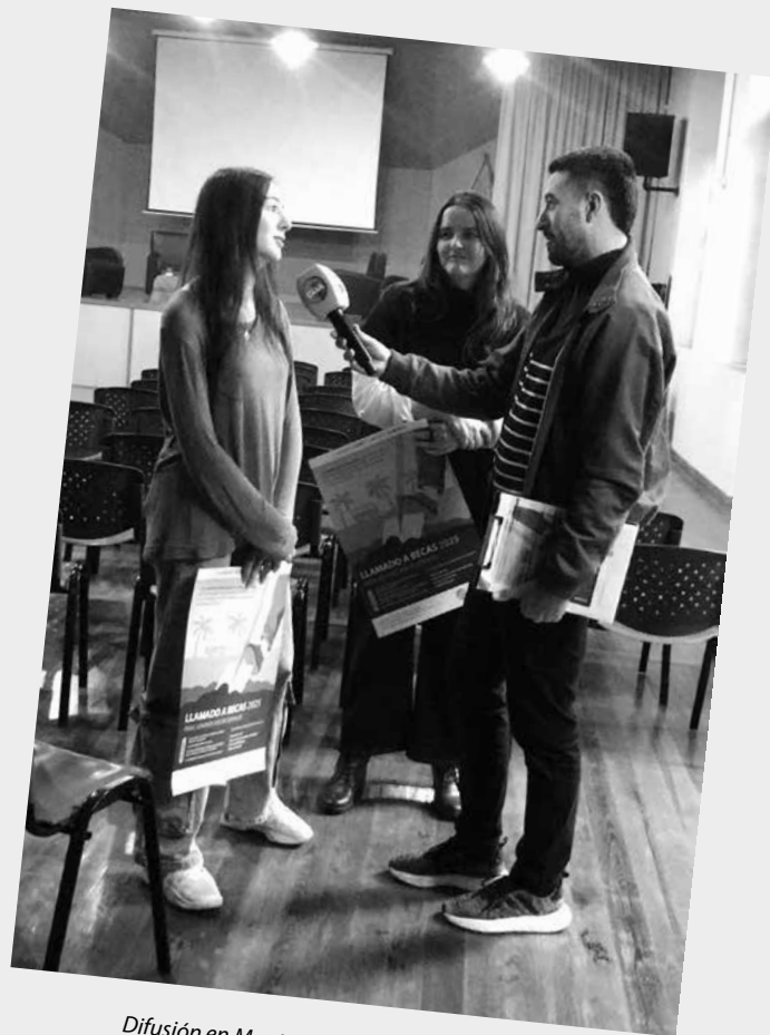
Difusión en Montevideo - La Mañana en Casa