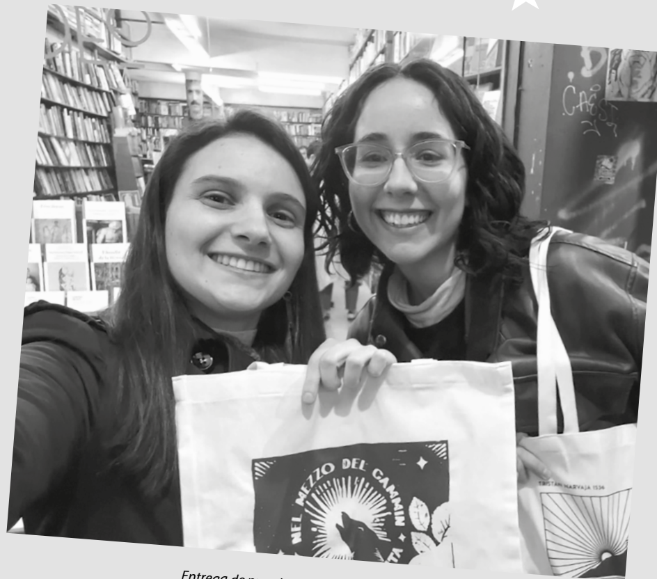
Entrega de premios a la ganadora del concurso

También participamos de las charlas que promueve AUCI (Agencia Uruguaya de Cooperación Internacional de Presidencia) en todo el país para dar a conocer las